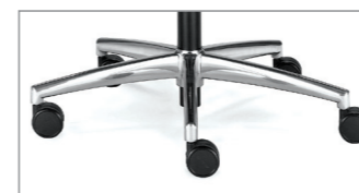
стандартная полированный алюминий