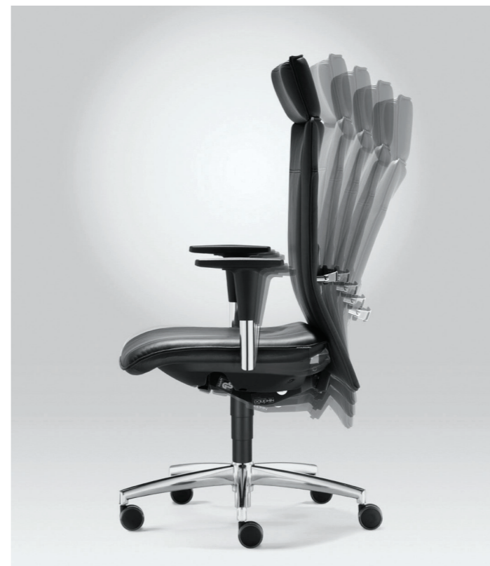
Работа механизма Syncro®-Dynamic