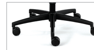
опция на заказ черный алюминий