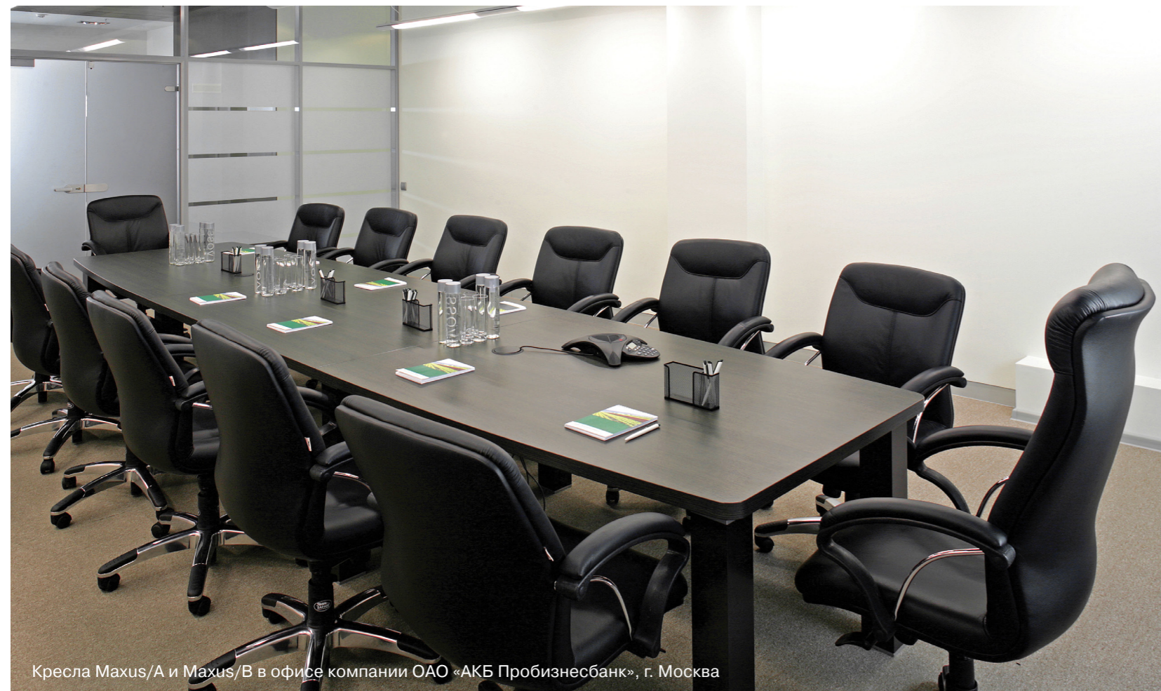
Кресла Maxus/A и Maxus/B в офисе компании ОАО «АКБ Пробизнесбанк», г. Москва