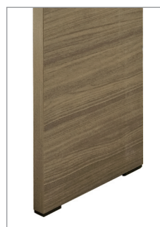
деревянная боковина цвет — орех