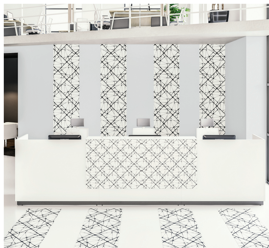
на заказ возможно нанесение любого изображения на навесную полку

* гидрофобное покрытие, защищающее поверхность стекла от загрязнений, препятствующее появлению пятен, разводов, мелких трещин, царапин и других дефектов в процессе эксплуатации