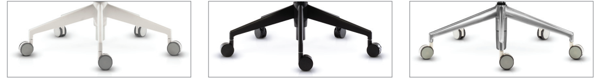
стандартная белый пластик