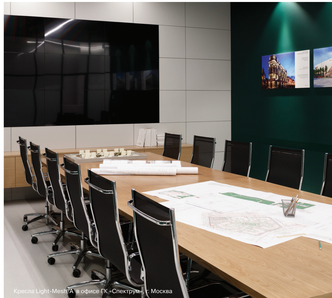
Кресла Light-Mesh/A в офисе ГК «Спектрум», г. Москва