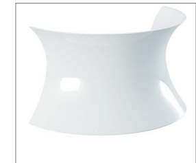
цвет — белый глянец