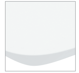
цвет — белый матовый