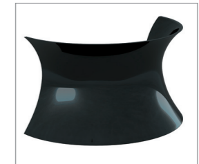
цвет — черный глянец