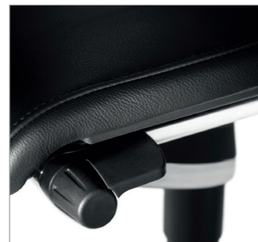
регулировка механизма Trimension®