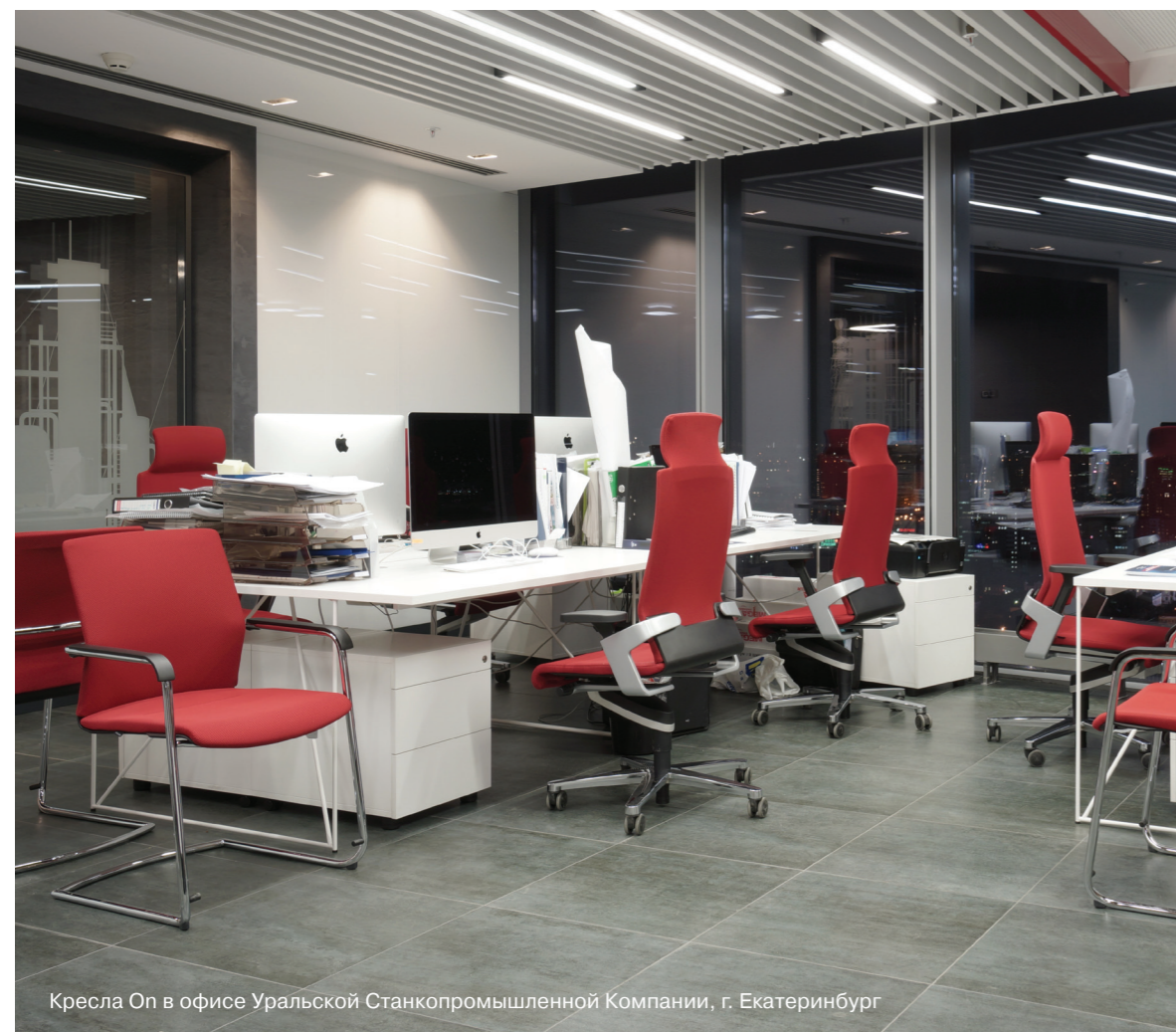
Кресла On в офисе Уральской Станкопромышленной Компании, г. Екатеринбург