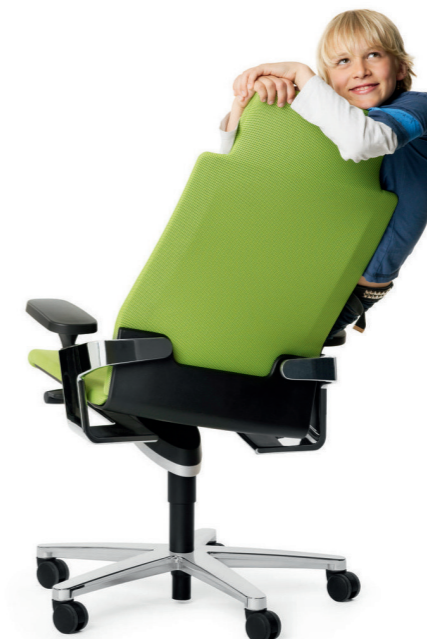
на заказ, срок поставки — 12 недель