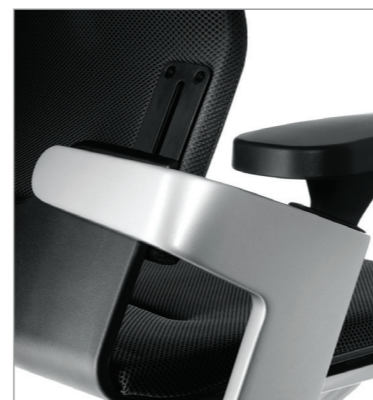
регулировка спинки по высоте с фиксацией в 6 положениях