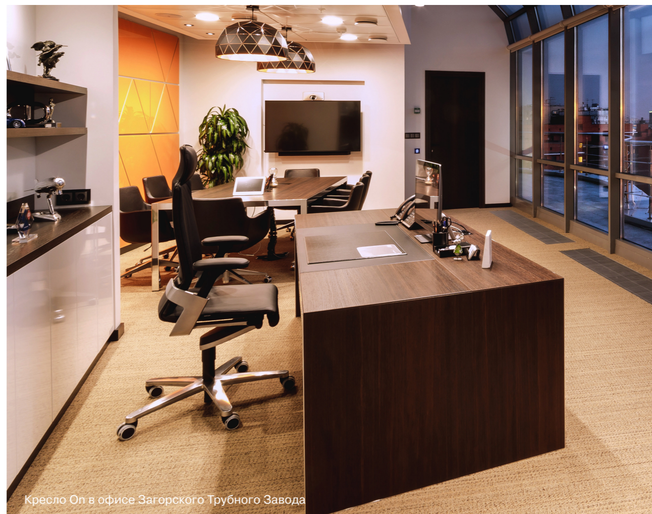
Кресло On в офисе Загорского Трубного Завода