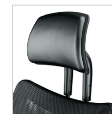
на заказ подголовник