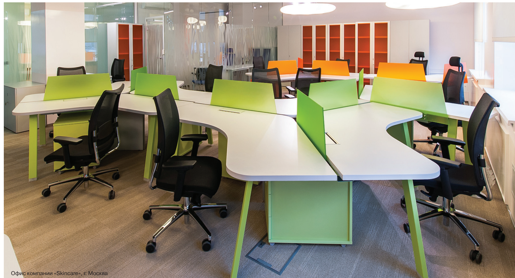
Офис компании «Skincare», г. Москва