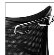
на заказ вешалка