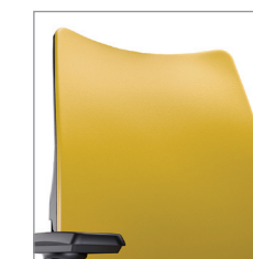
на заказ спинка в коже

Спинка выполнена в сетке — дышащем материале Поддержка поясницы, регулируемая по высоте Сиденье выполнено в сетке — дышащем материале Регулировка синхро-механизма и фиксация спинки (опция sliding seat — на заказ) База — серый пластик 3D подлокотники, регулируемые по высоте, глубине и ширине Основа сиденья выполнена из металла Регулировка сиденья по высоте Регулировка жесткости пружины по весу сидящего Прорезиненные ролики для твердых напольных покрытий