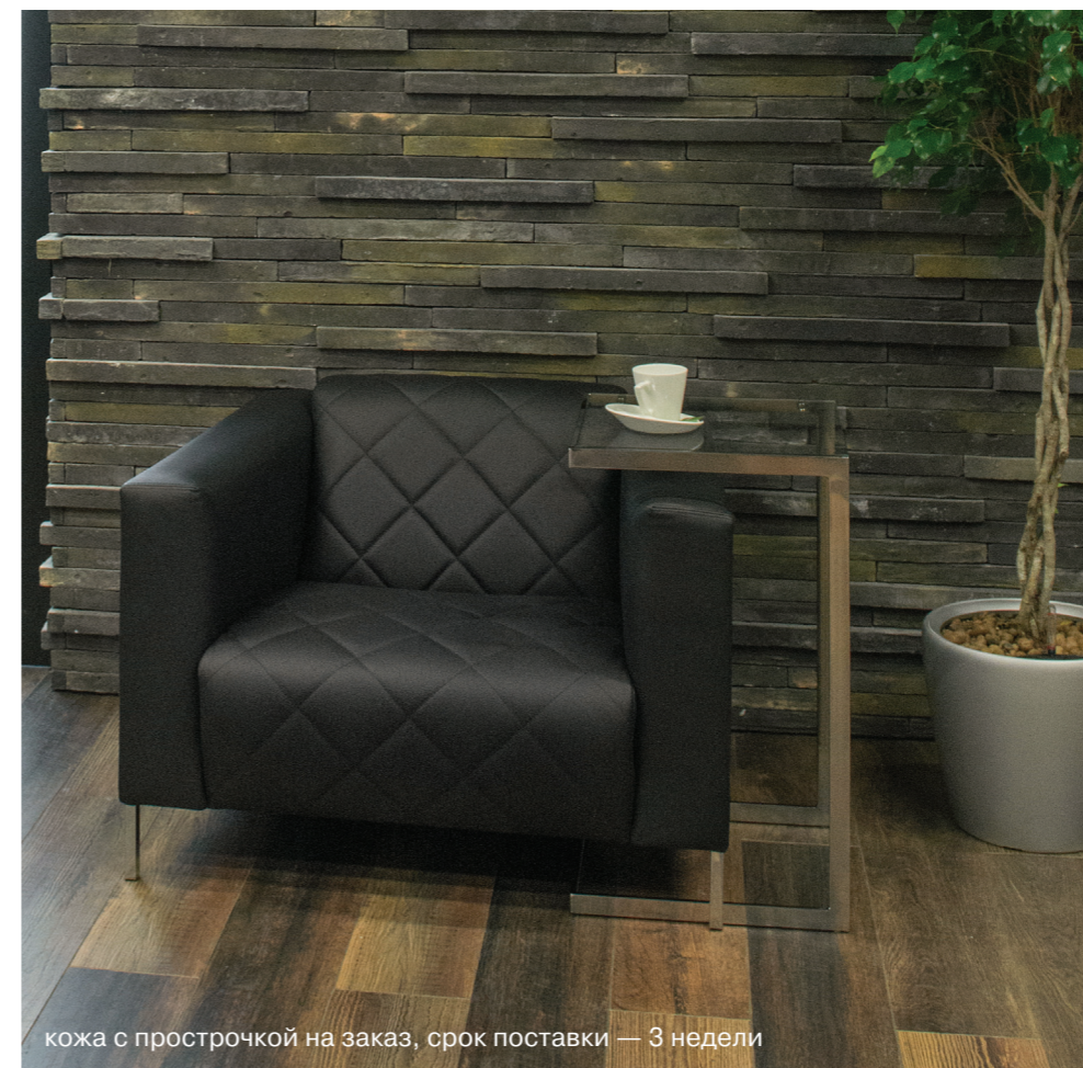
кожа с прострочкой на заказ, срок поставки — 3 недели