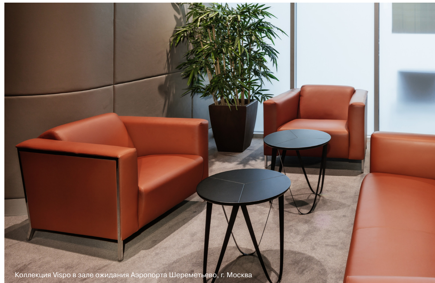
Коллекция Vispo в зале ожидания Аэропорта Шереметьево, г. Москва