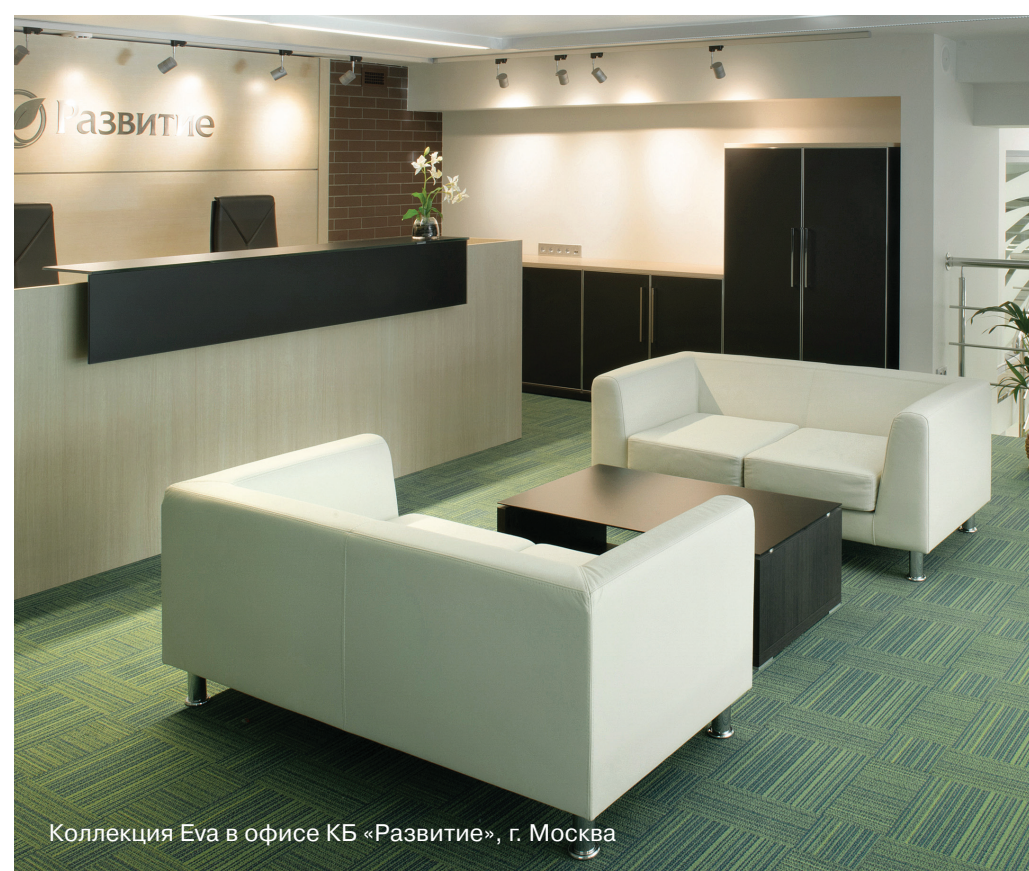
Коллекция Eva в офисе КБ «Развитие», г. Москва