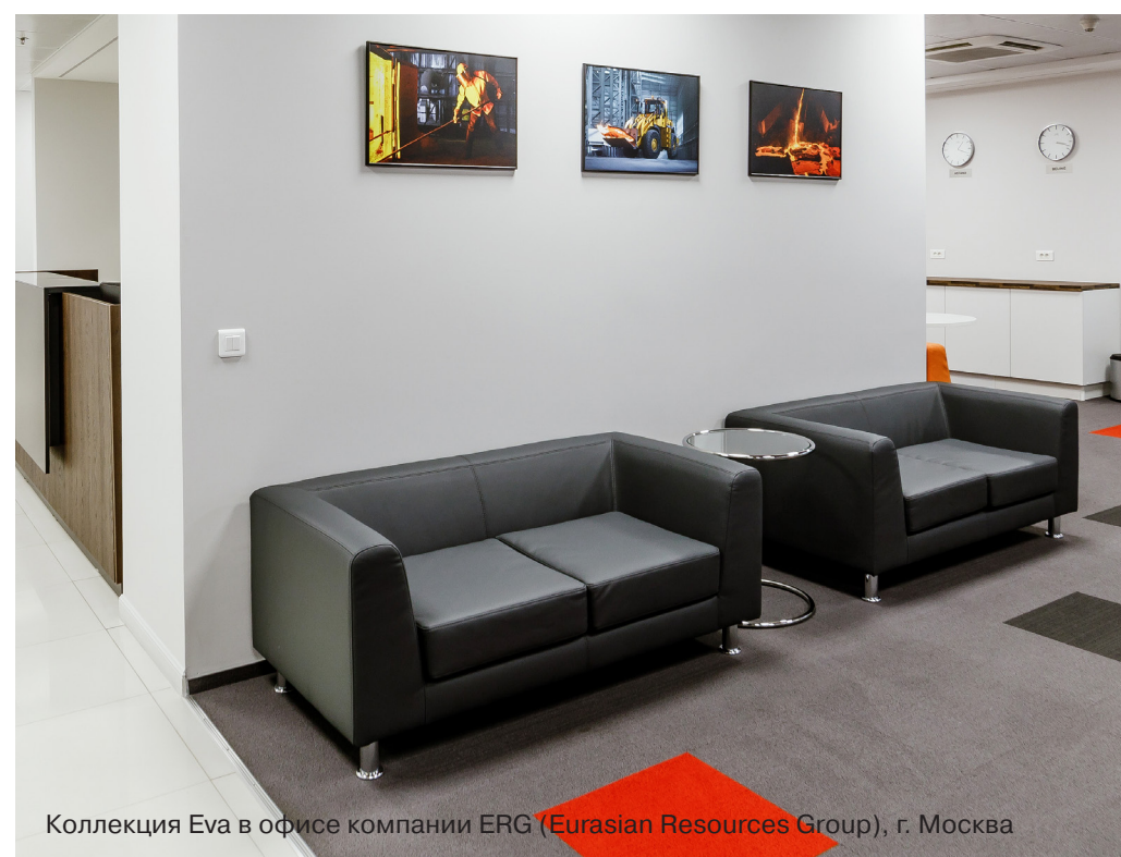
Коллекция Eva в офисе компании ERG (Eurasian Resources Group), г. Москва