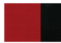
бордовый / черный