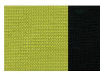
зеленый / черный