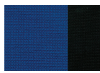
синий / черный