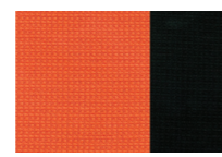
оранжевый / черный

Возможно изготовление съемных чехлов на сиденье (на заказ)*