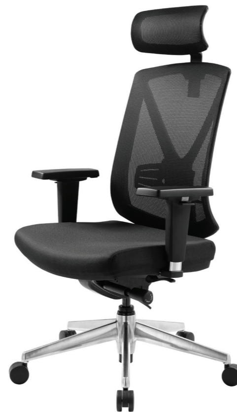
вариант с подголовником на хромированной базе — на заказ**

Регулировка сиденья по глубине («sliding seat») обеспечивает оптимальную поддержку бедер