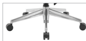
на заказ** матовый алюминий