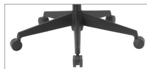
стандартная черный пластик