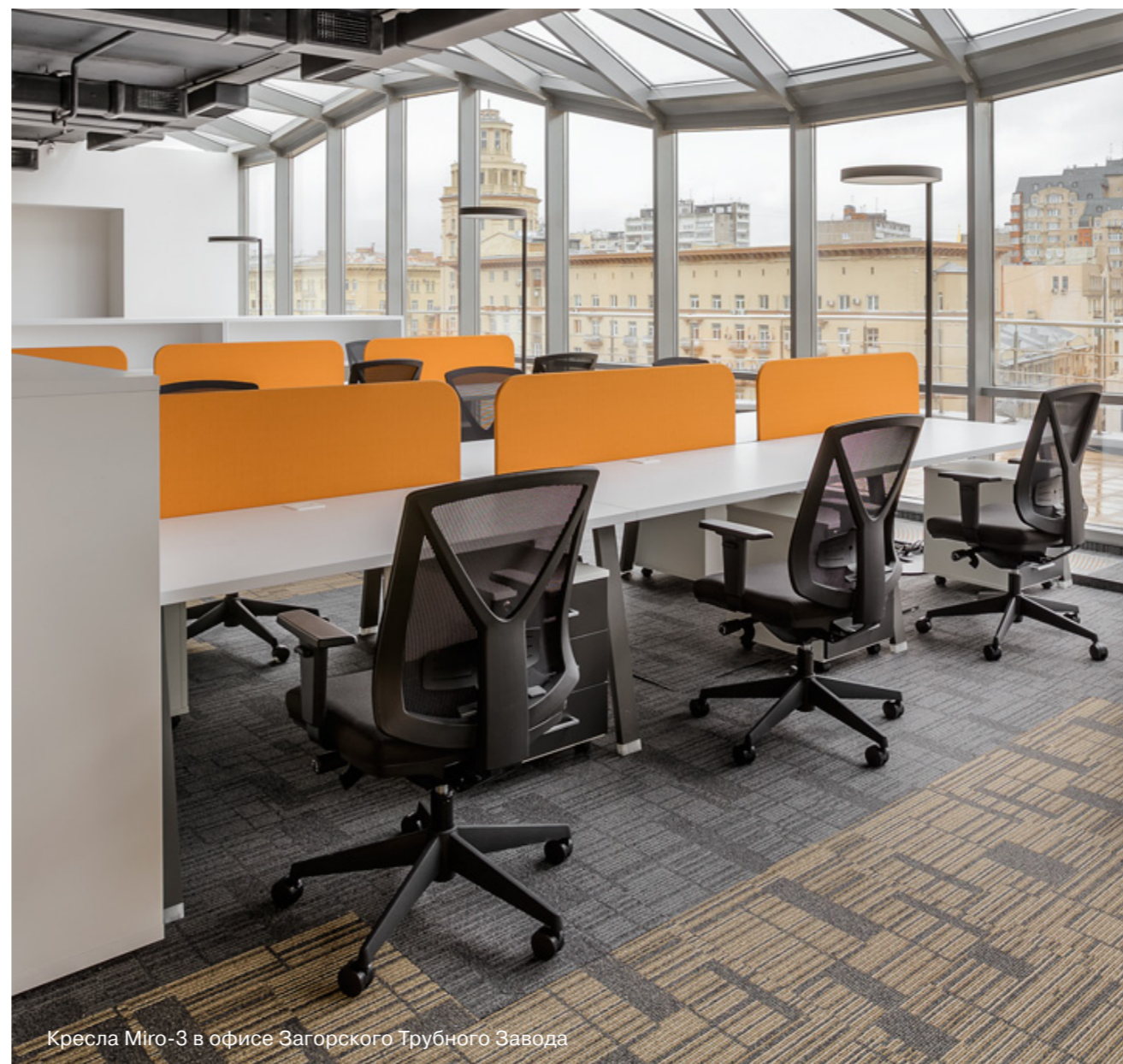
Кресла Miro-3 в офисе Загорского Трубного Завода

Возможно изготовление съемных чехлов на сиденье (на заказ)*