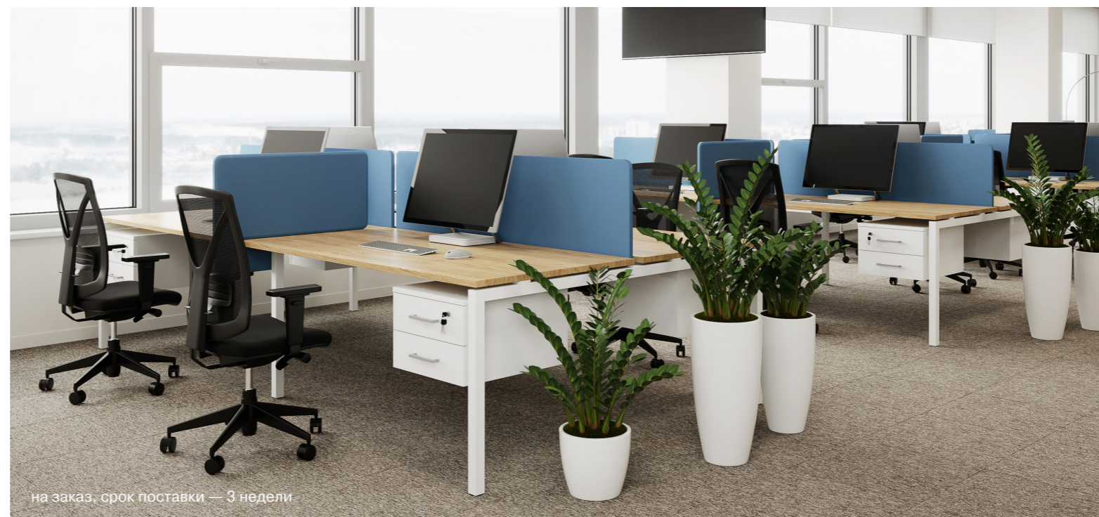
на заказ, срок поставки — 3 недели