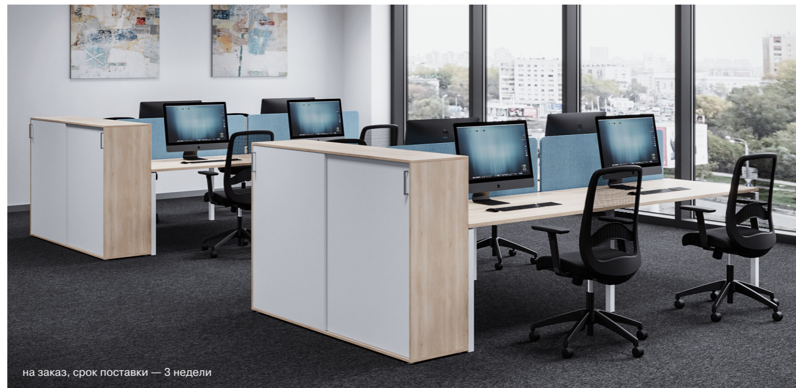
на заказ, срок поставки — 3 недели