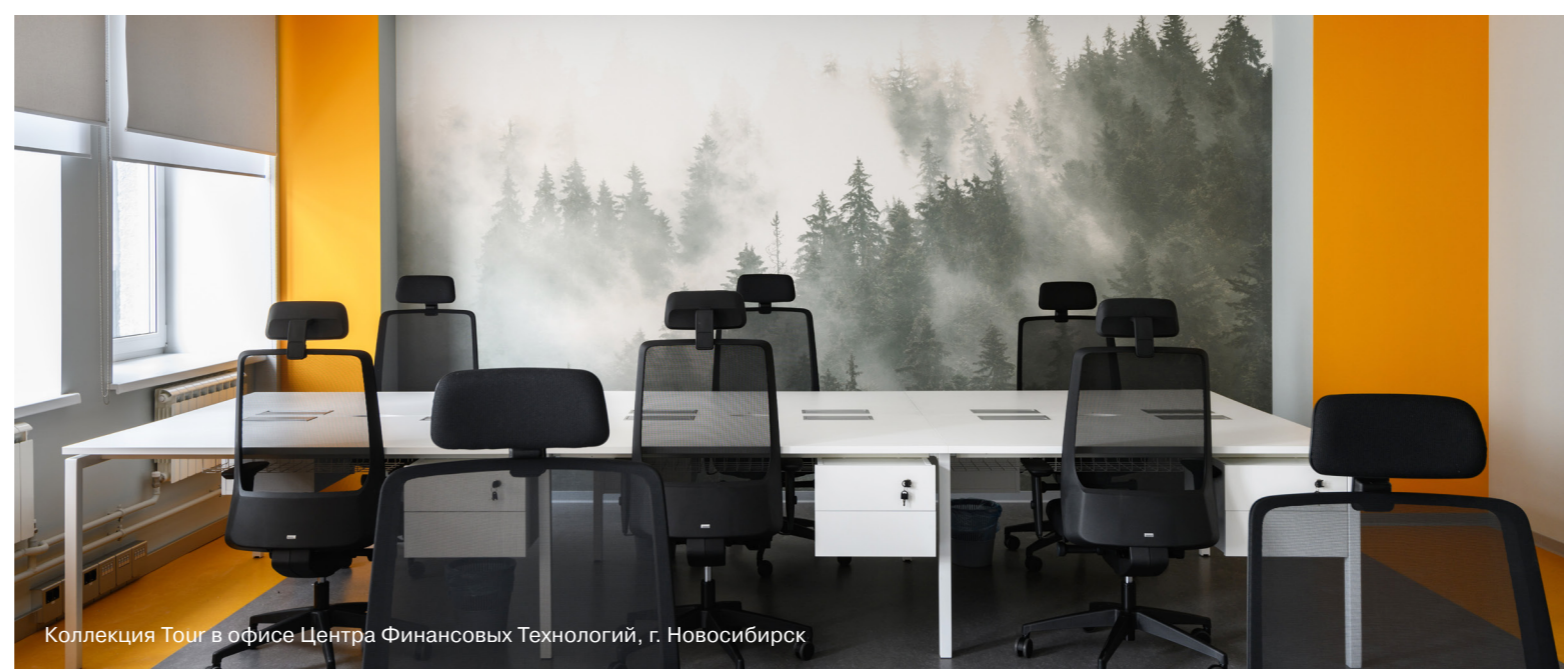
Коллекция Tour в офисе Центра Финансовых Технологий, г. Новосибирск