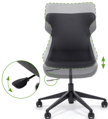
Регулировка высоты сиденья

Для комфортного пользования креслом рекомендуем настроить его перед использованием.