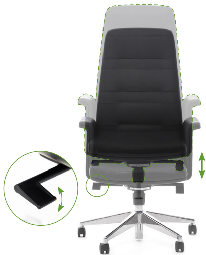
Регулировка высоты сиденья

Для комфортного пользования креслом рекомендуем настроить его перед использованием.