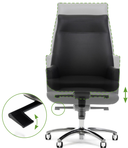
Регулировка высоты сиденья

Для комфортного пользования креслом рекомендуем настроить его перед использованием.